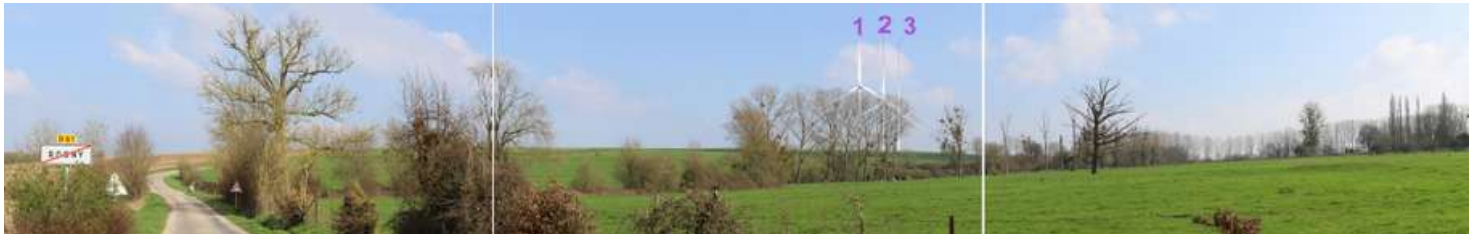
Photomontage depuis la sortie nord du village de Rogny, depuis la D61

Le volet paysager de l'étude d'impact contient 50 photomontages qui permettent de visualiser ce projet de parc éolien depuis de nombreux points de vue. Trois d'entre eux sont présentés ci-dessous, d'autres seront présentés lors de la permanence d'information du 29 janvier et seront mis en ligne sur le site Internet du projet (voir page 1).