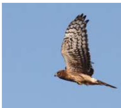
Busard Saint-Martin

Au cours de l'année 2023, des écologues du bureau d'étude expert Envol Environnement ont recensé les espèces présentes sur la zone d'étude. Ces observations ont été menées durant un cycle biologique complet : migration pré-nuptiale, nidification, migration post-nuptiale et hivernage, avec une trentaine de sorties réalisées, sur des plages horaires variées. La flore, les mammifères, les insectes, les amphibiens, les reptiles ont été recensés et une attention particulière a été portée sur les oiseaux et les chauves-souris.