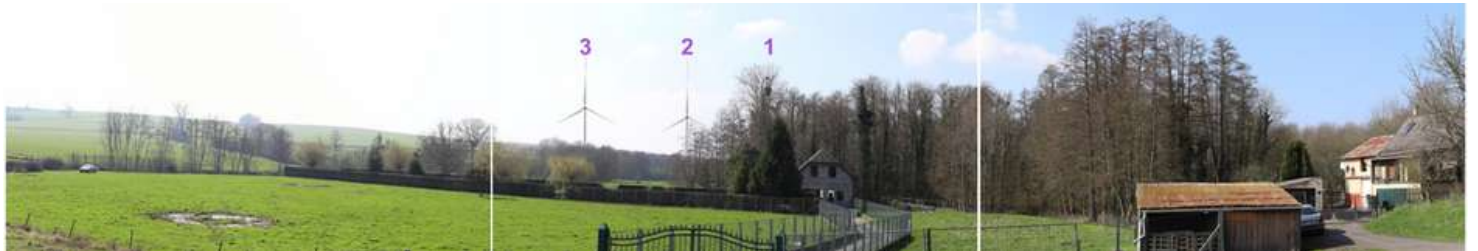
Photomontage depuis la sortie Sud du village de Houry, aux abords de l'Eglise