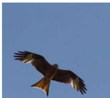
Milan Royal

Certaines espèces d'oiseaux à patrimonialité forte ont pu être observées, comme le Busard-Saint-Martin ou le Milan Royal.