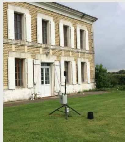
Sonomètre d'une étude acoustique

Des simulations acoustiques ont par la suite été réalisées pour calculer le bruit supplémentaire généré par les éoliennes. Le parc respectera la réglementation en terme de bruit. Un plan de bridage acoustique, qui consiste à ralentir les éoliennes lors de conditions de vents spécifiques, est prévu afin de s'en assurer. Ce plan de bridage pourra être adapté à la suite des contrôles d'émergence acoustique effectués après mise en service du parc.